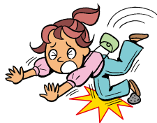
旅行中に転倒して骨折