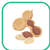
落花生 (ピーナッツ)